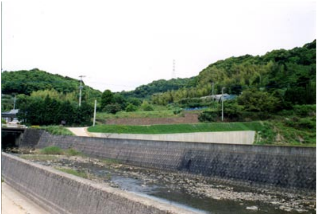
写真3 小田貝塚遠景 (2001年撮影, 手前は河通川)