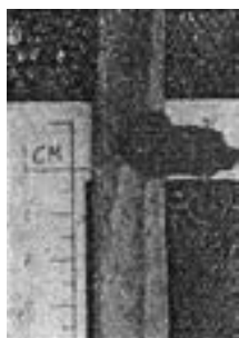
写真1 鉄鏃附着状況(八重津1924)