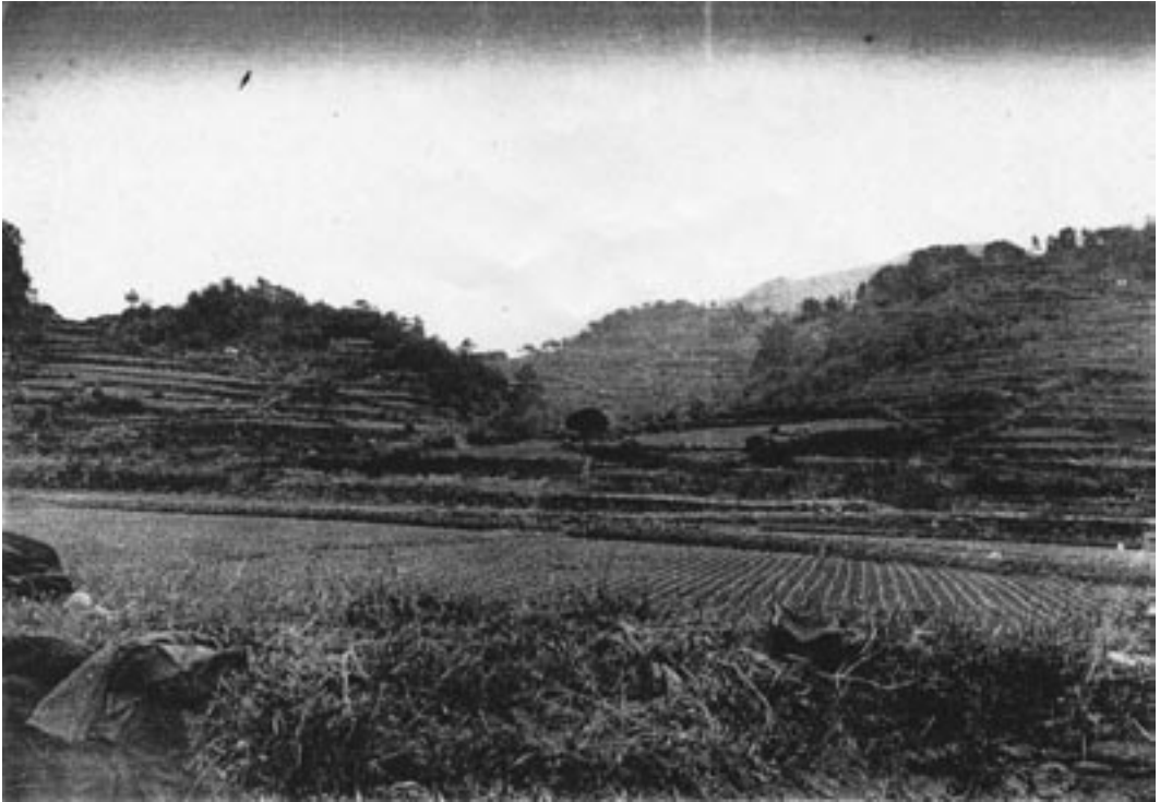
写真2 小田貝塚遠景 (1924年撮影, 内山 1926)