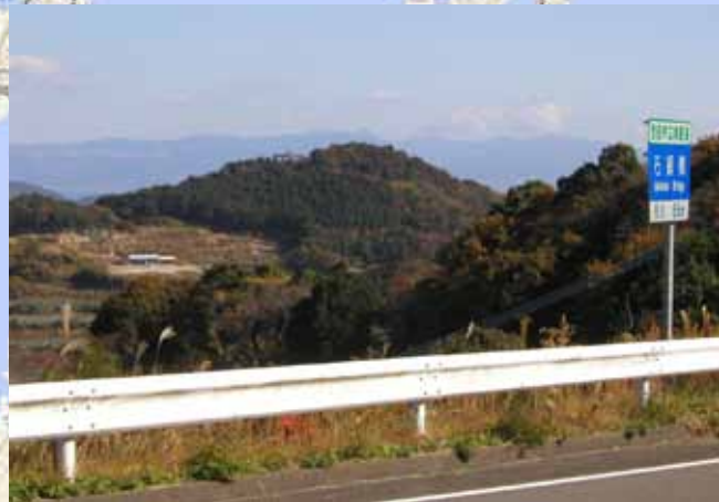
写真2 八人ヶ岳遠景（石鍋橋から撮影）