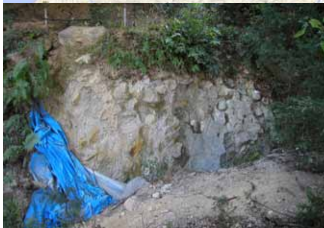
写真1 下茅場遺跡A地点（北から撮影）

南側橋脚下の製作所跡。ブルーシートを覆うことによって保存していたと思われます。しかし、風雨の影響で剥がれたのか、今では製作所跡が露出した状態となっています。