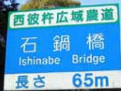
写真1 石鍋橋看板（南から撮影）