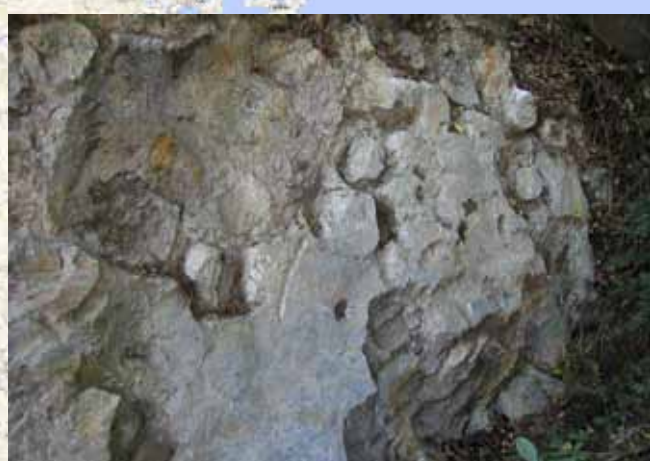
写真4 下茅場遺跡A地点拡大（北から撮影）

凹みは1人が一度に算出できる範囲を示していると考えます。この見解は下川達彌氏が指摘されている説です。